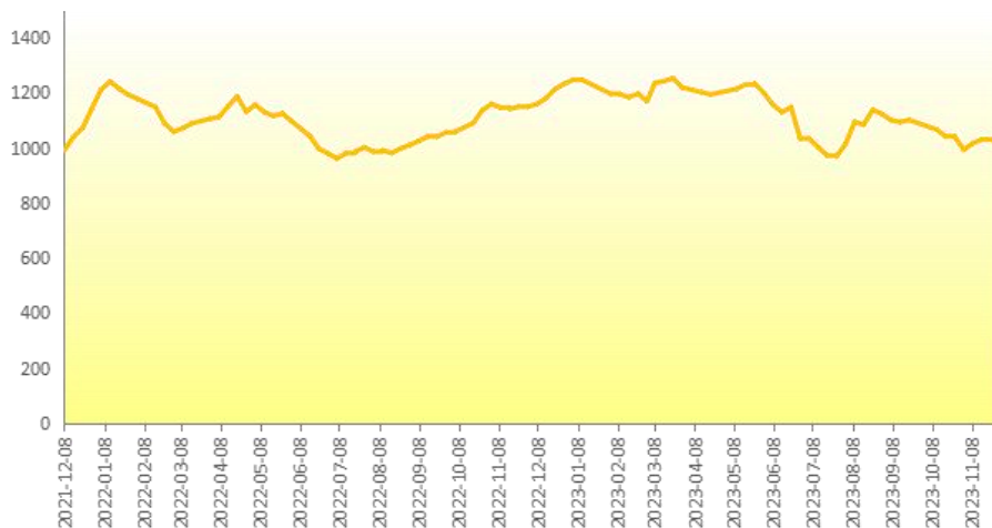
图 5 新华-进口香蕉价格指数