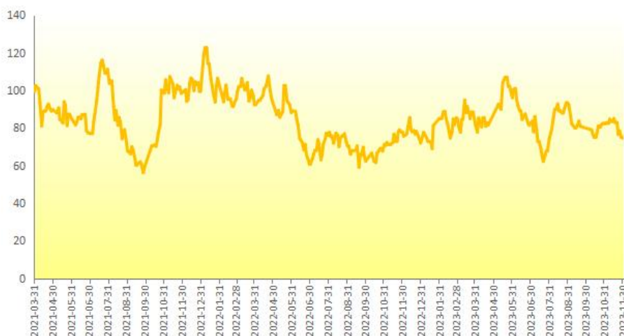
图 1 新华-中国香蕉产地价格指数