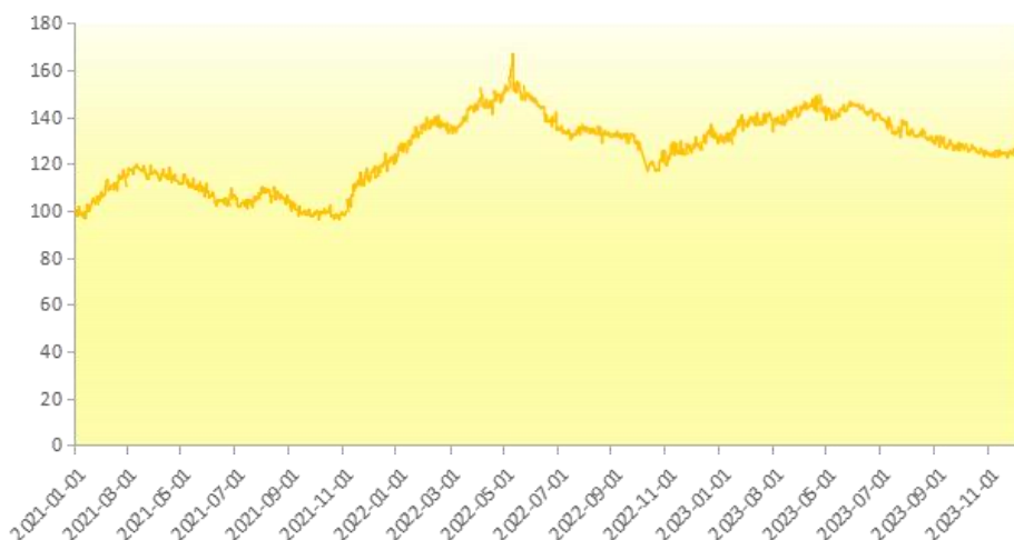
图 4 新华-香蕉销地批发价格指数