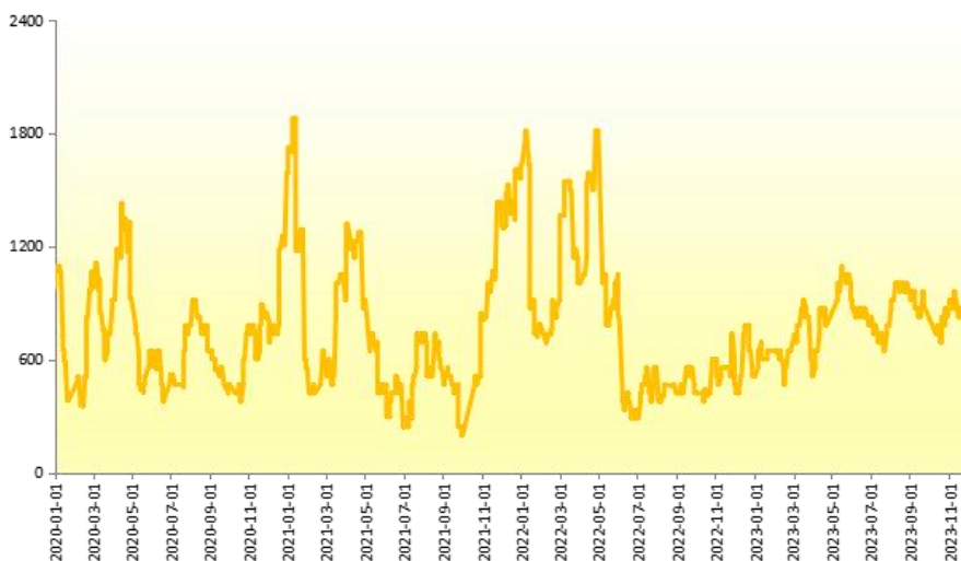
图 2 新华-中国（海南）皇帝蕉产地价格指数