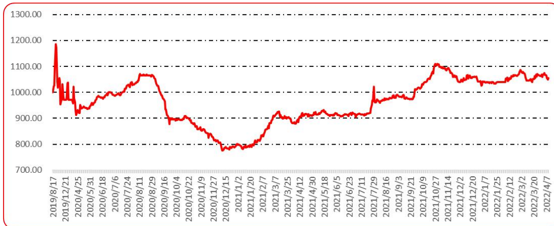
图 9 新一代（干椒）批发价格指数运行图