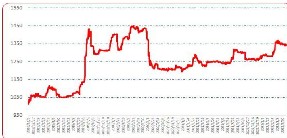
图 2 中国遵义朝天椒（干椒）批发价格综合指数运行图