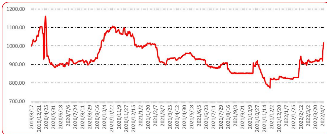
图 10 印度进口椒批发价格指数运行图