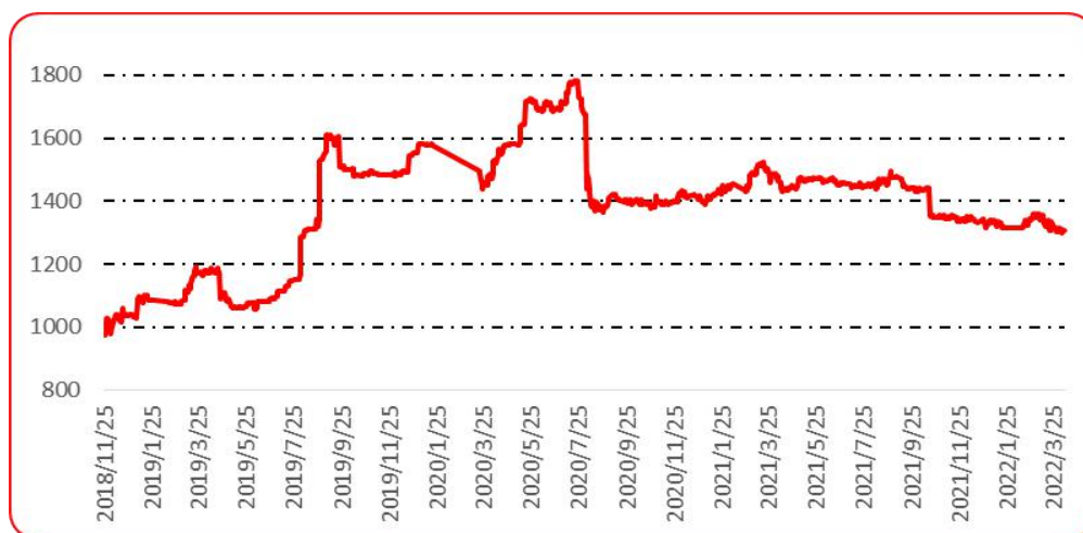
图 4 满天星批发价格指数运行图