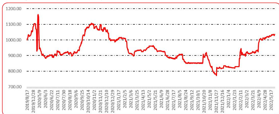
图 10 印度进口椒批发价格指数运行图