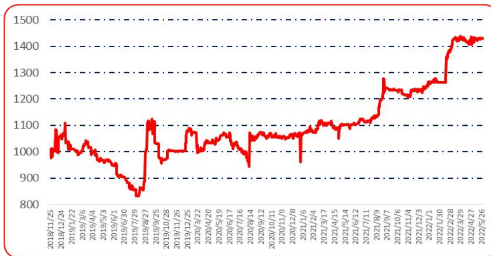
图 6 锥形椒批发价格指数运行图