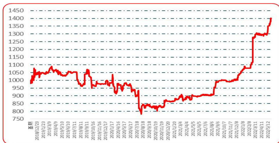
图 7 樱桃形椒批发价格指数运行图