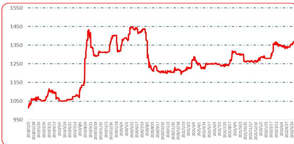
图 2 中国遵义朝天椒（干椒）批发价格综合指数运行图