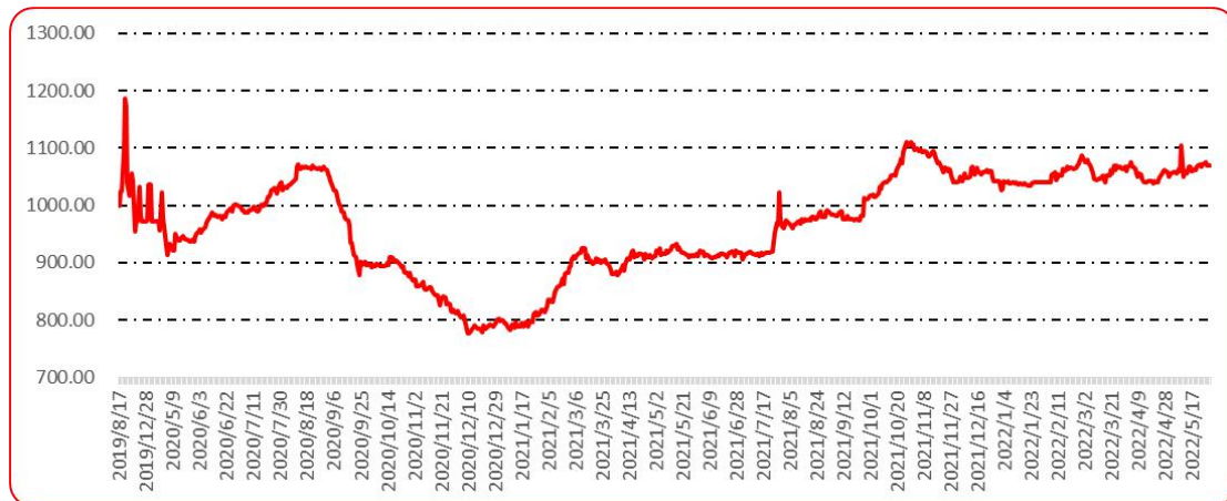
图 9 新一代（干椒）批发价格指数运行图