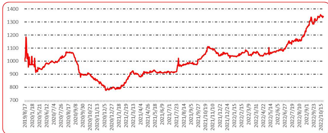
图 9 新一代（干椒）批发价格指数运行图