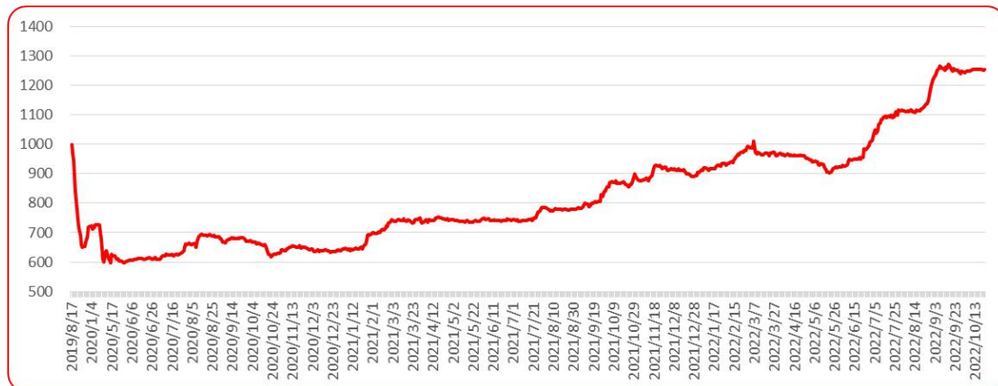
图 8 三樱椒（干椒）批发价格指数运行图