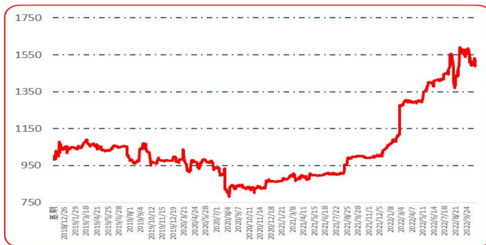
图 7 樱桃形椒批发价格指数运行图