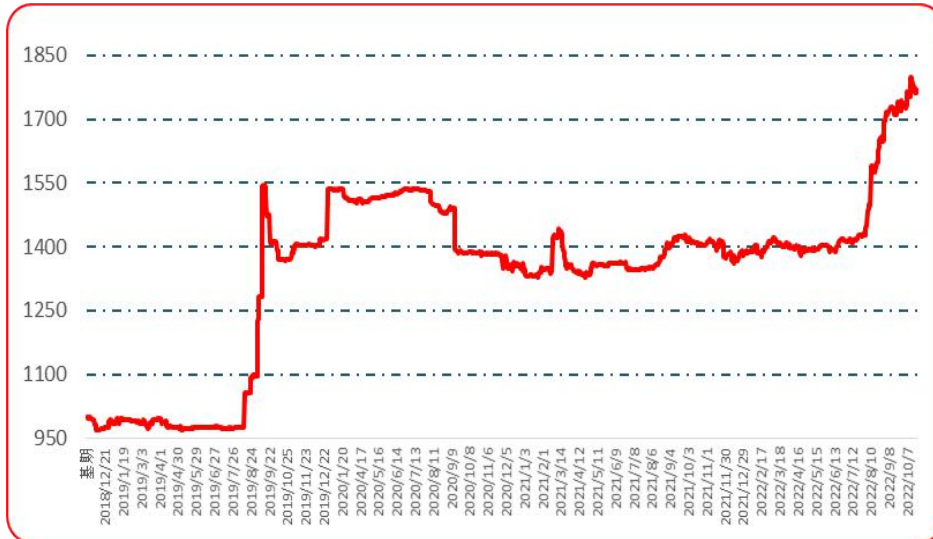
图 5 遵义朝天椒 1 号批发价格指数运行图