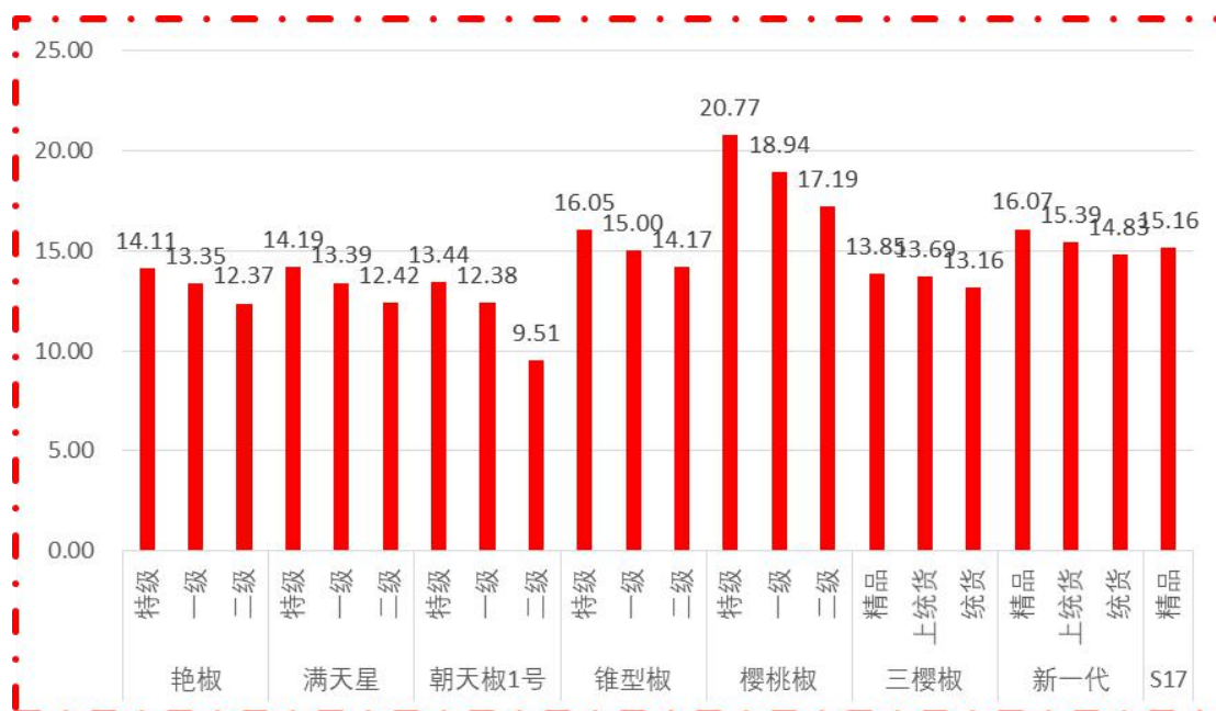
图 1 各品种、各等级周度均价 (数据来源: 新华指数)