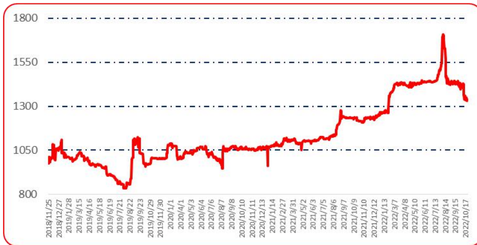
图 6 锥形椒批发价格指数运行图