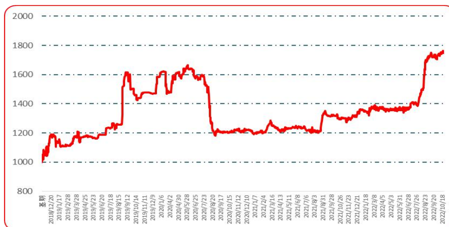
图 3 艳椒批发价格指数运行图