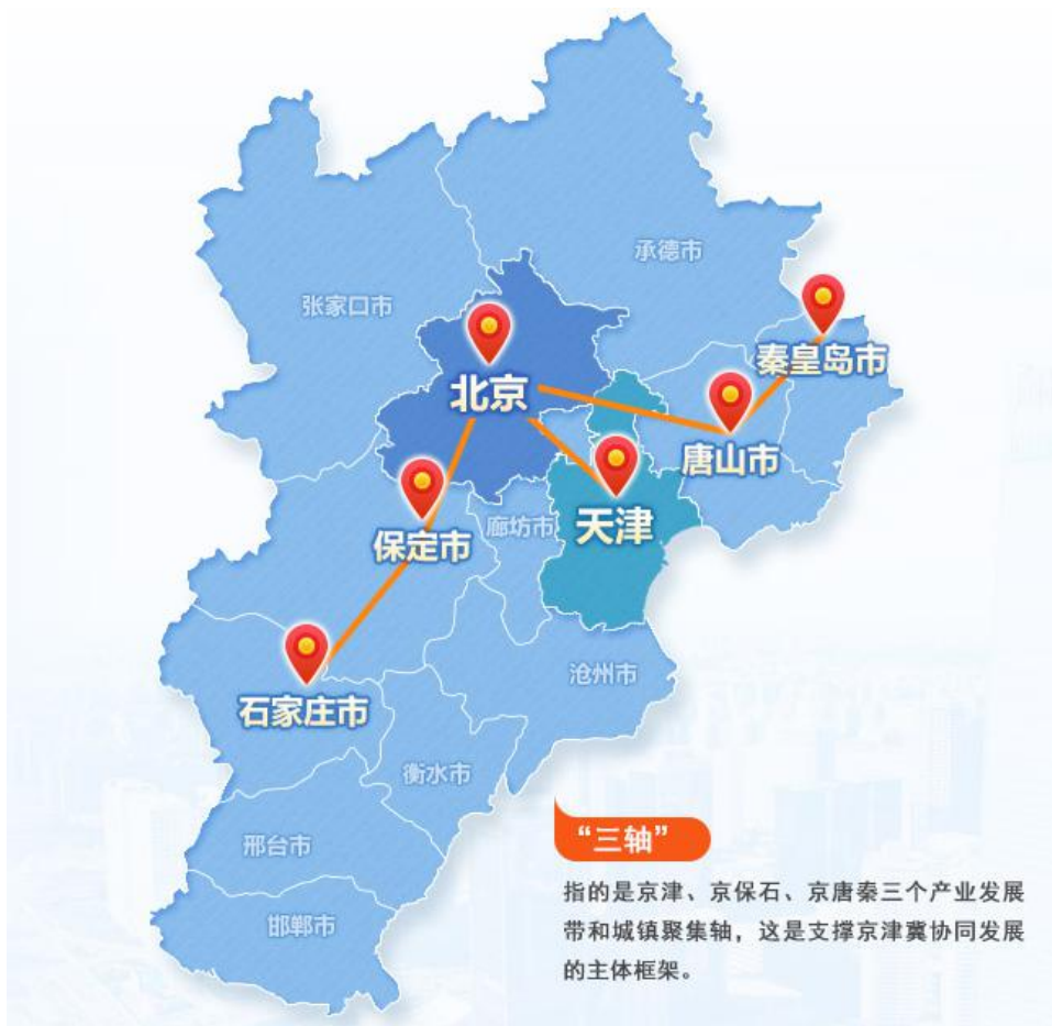
图表 4：京津冀区域空间布局

此外，京津冀地区多个重点区域加快联动发展，发挥带动示范作用。北京城市副中心、雄安新区两翼齐飞，打造区域联动“桥头堡”。北京城市副中心所在的通州区2022年实现地区生产总值1253.4亿元，固定资产投资规模保持千亿量级，各类资源加快聚集。雄安新区“雏形显现”，城市框架全面拉开，承接北京非首都功能疏解取得突破，首批标志性疏解项目有序推进，3家央企总部开工建设，中国矿产资源集团、4所高校和2家医院选址落位，央企设立各类分支机构140多家。此外，协同发展示范区亮点频出：通州与北三县加速一体化发展，专项规划出台；大兴机场横跨京冀、“三区叠加”，着力推动区港城协同发展；滨海新区承接非首都功能疏解成效显著，2022年承接北京非首都功能疏解重大项目62个，总投资620.82亿元，引进北京在津新设机构360个，注册资金928.63亿元。