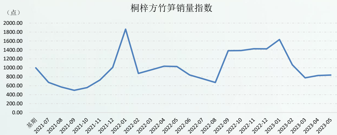
图 1 新华·桐梓方竹笋销量指数