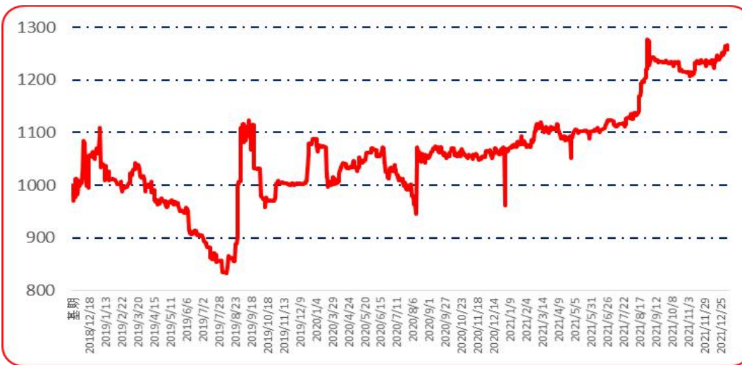
图 6 锥形椒批发价格指数运行图