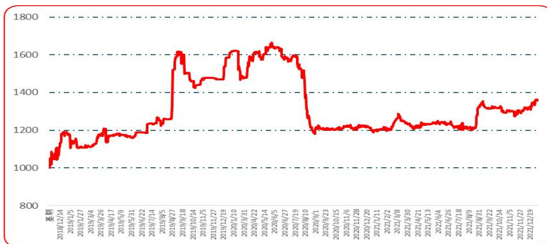
图 3 艳椒批发价格指数运行图