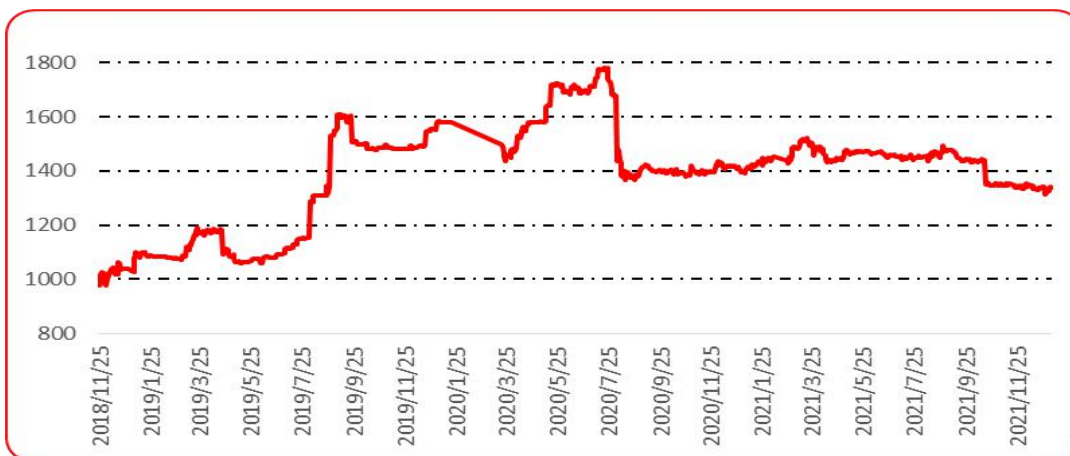
图 4 满天星批发价格指数运行图