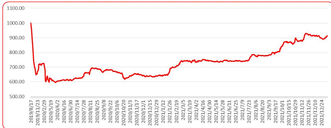
图 8 三樱椒（干椒）批发价格指数运行图