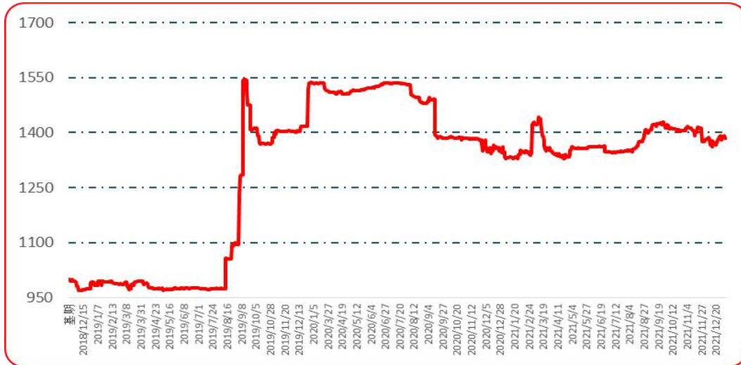
图 5 遵义朝天椒 1 号批发价格指数运行图