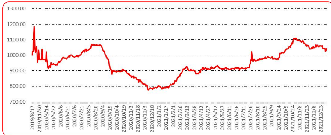
图 9 新一代（干椒）批发价格指数运行图