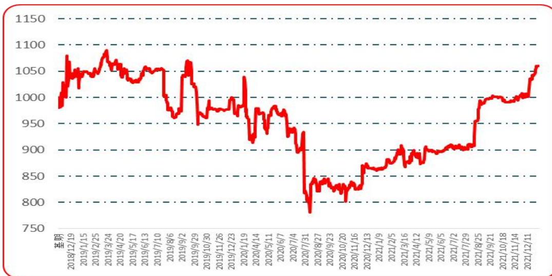
图 7 樱桃形椒批发价格指数运行图