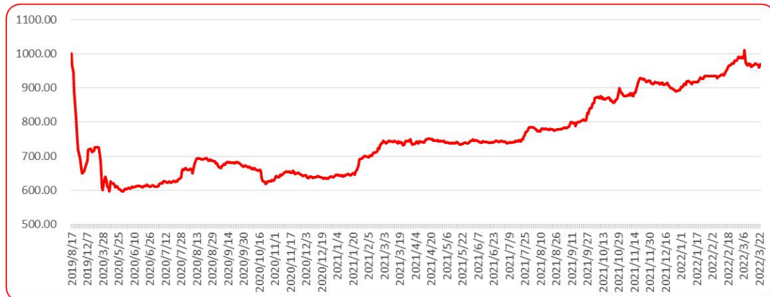
图 8 三樱椒（干椒）批发价格指数运行图