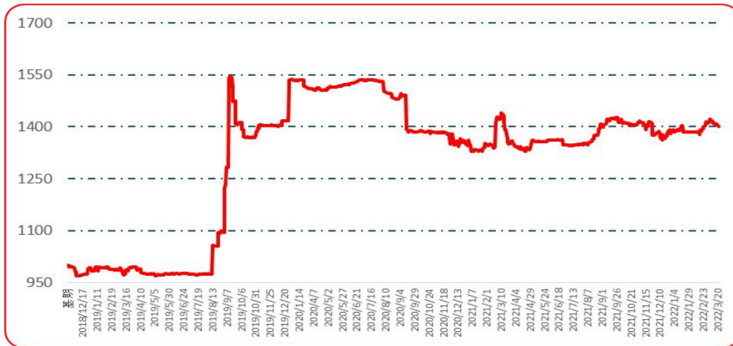
图 5 遵义朝天椒 1 号批发价格指数运行图