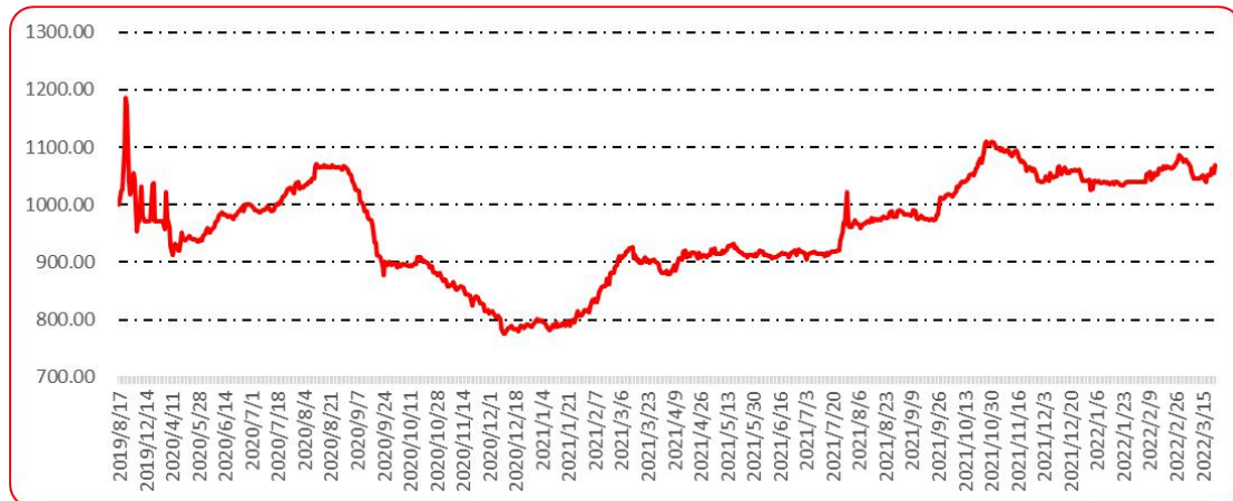
图 9 新一代（干椒）批发价格指数运行图