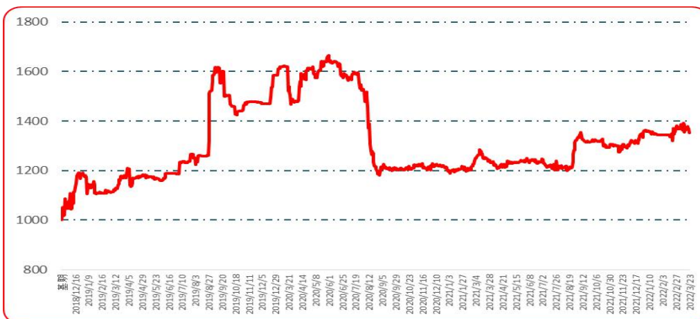
图 3 艳椒批发价格指数运行图