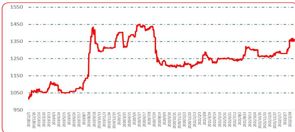
图 2 中国遵义朝天椒（干椒）批发价格综合指数运行图