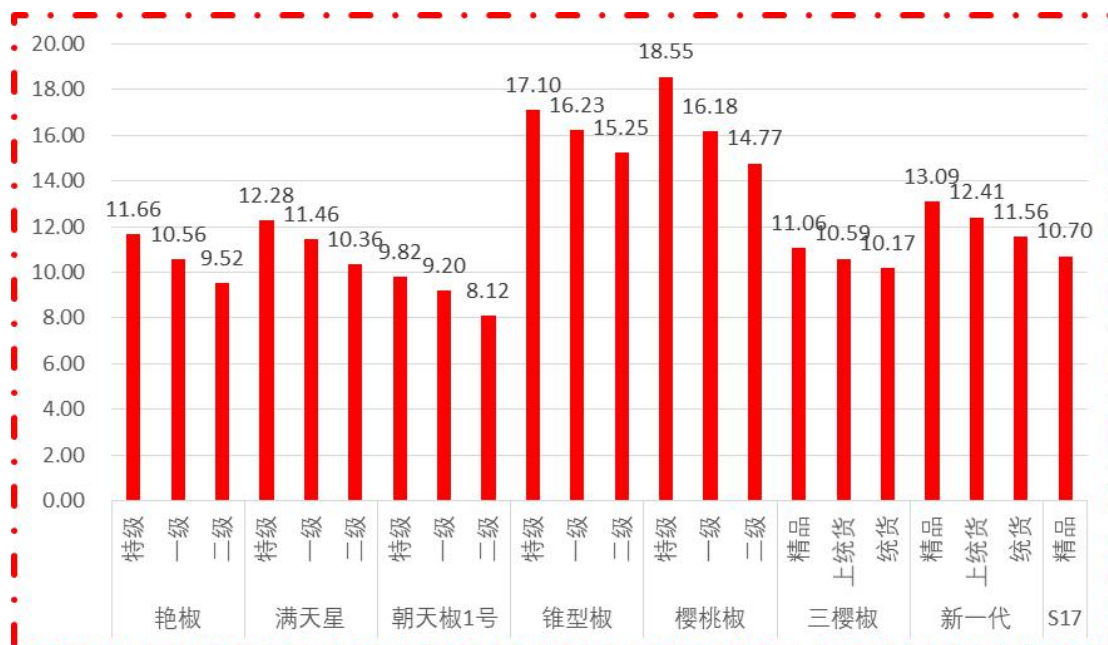
图 1 各品种、各等级周度均价（数据来源：新华指数）