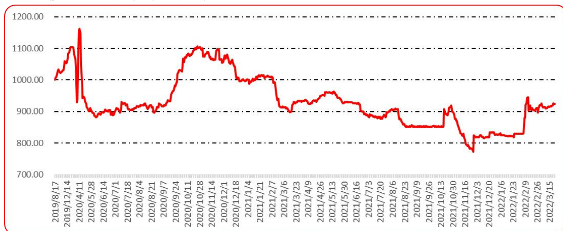
图 10 印度进口椒批发价格指数运行图