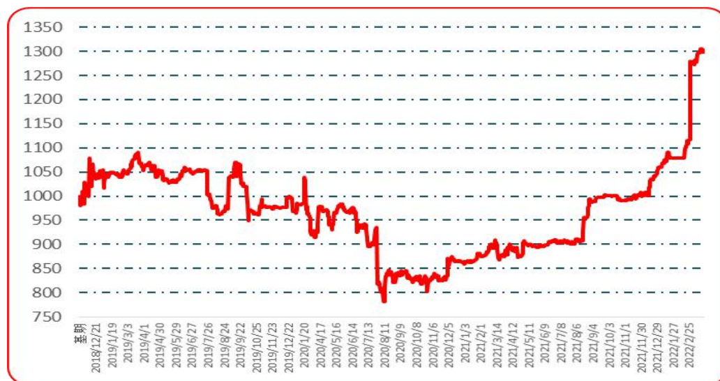
图 7 樱桃形椒批发价格指数运行图