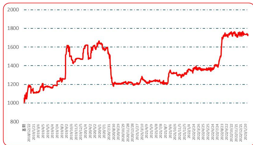
图 3 艳椒批发价格指数运行图