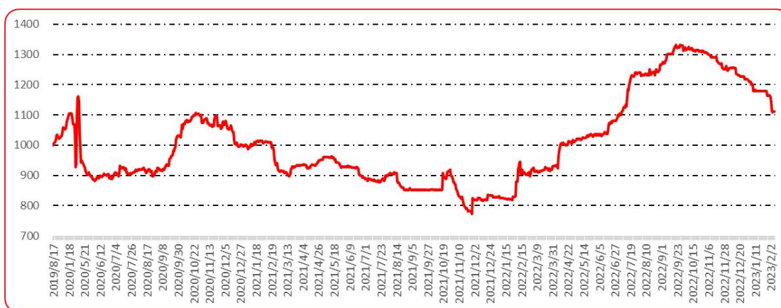
图 10 印度进口椒批发价格指数运行图