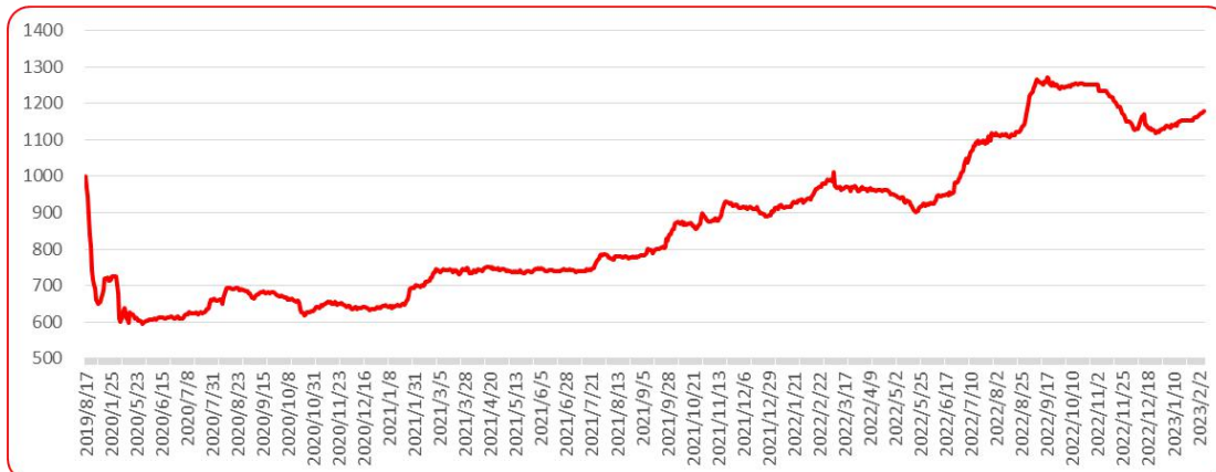
图 8 三樱椒（干椒）批发价格指数运行图