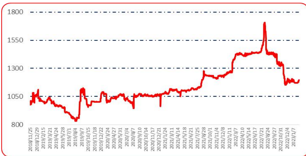
图 6 锥形椒批发价格指数运行图