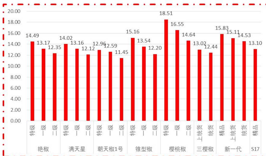
图 1 各品种、各等级周度均价