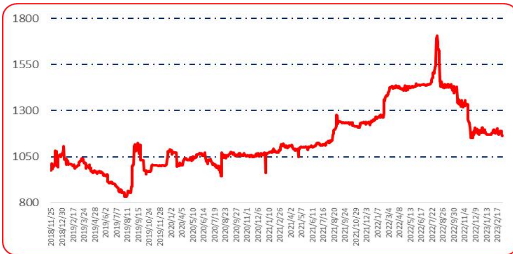
图 6 锥形椒批发价格指数运行图