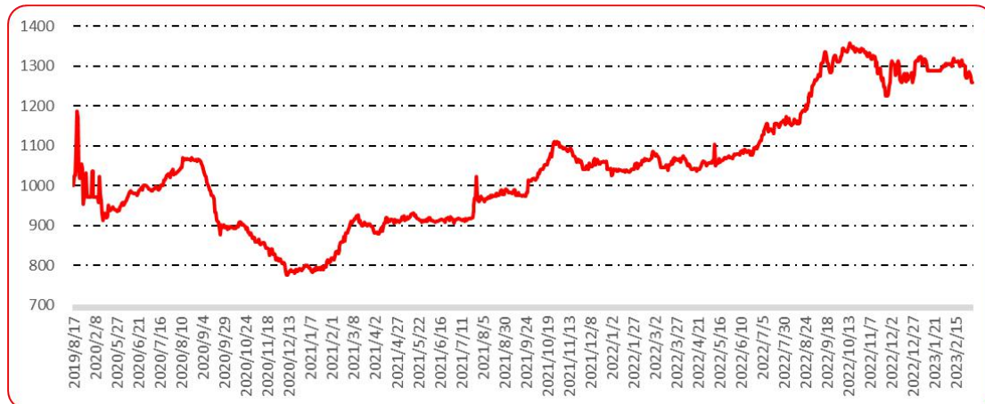
图 9 新一代（干椒）批发价格指数运行图