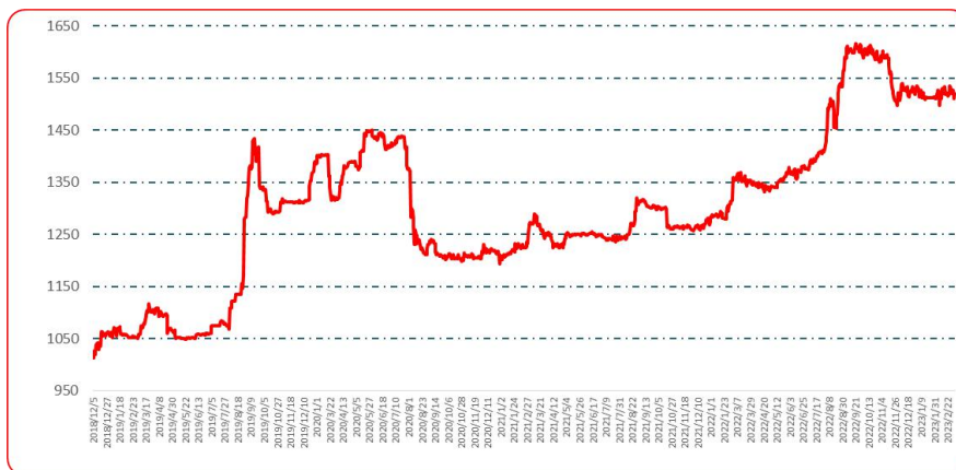
图 2 中国遵义朝天椒（干椒）批发价格综合指数运行图