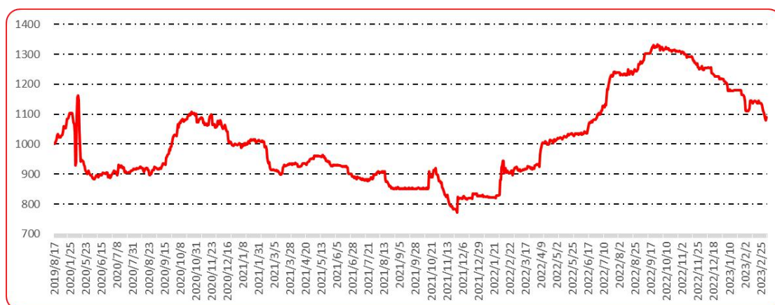
图 10 印度进口椒批发价格指数运行图