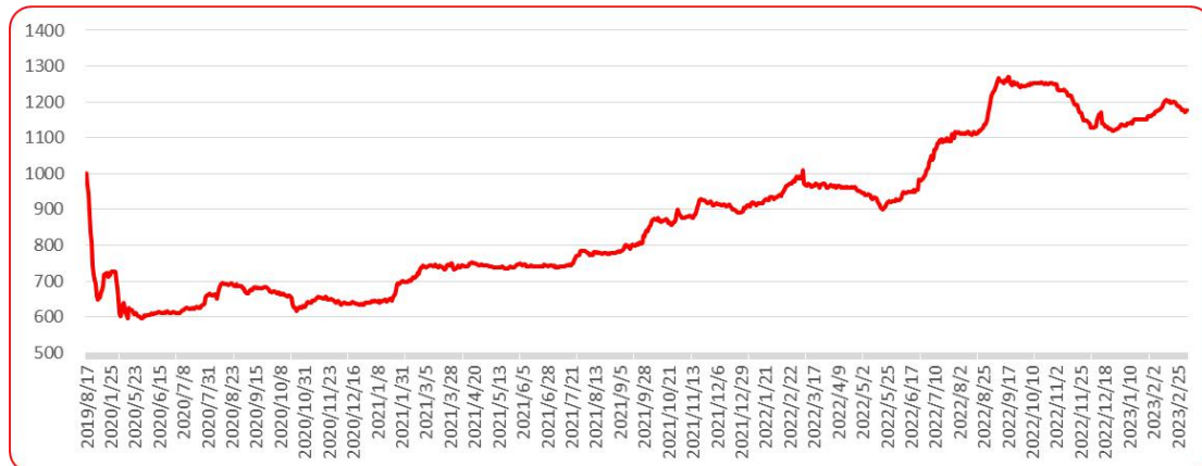
图 8 三樱椒（干椒）批发价格指数运行图