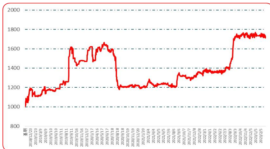
图 3 艳椒批发价格指数运行图