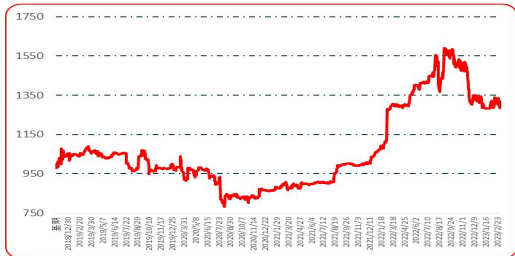
图 7 樱桃形椒批发价格指数运行图