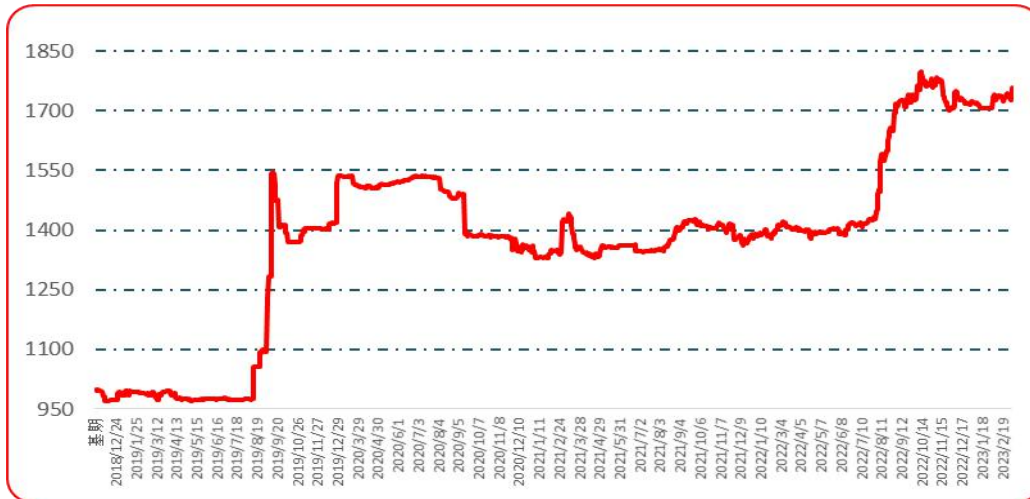
图 5 遵义朝天椒 1 号批发价格指数运行图