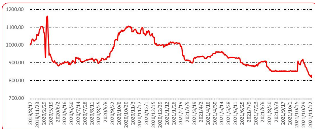
图 10 印度进口椒批发价格指数运行图