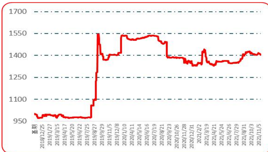
图 5 遵义朝天椒 1 号批发价格指数运行图