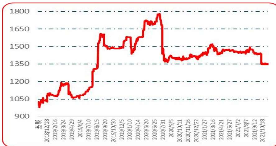
图 4 满天星批发价格指数运行图