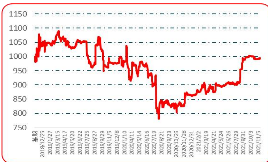
图 7 樱桃形椒批发价格指数运行图