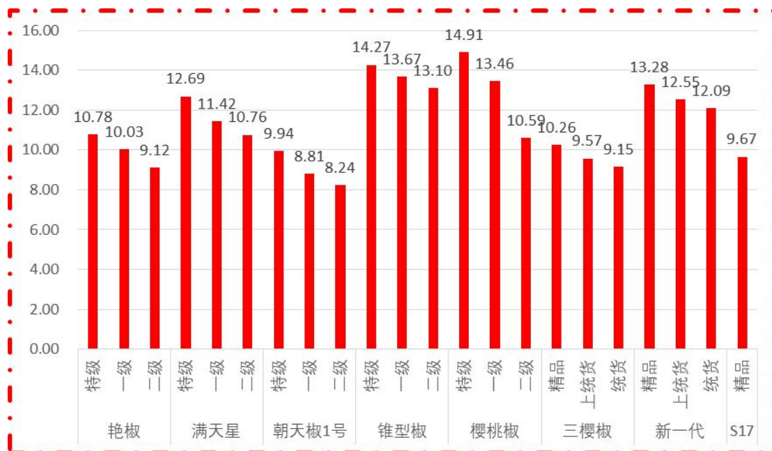
图 1 各品种、各等级周度均价