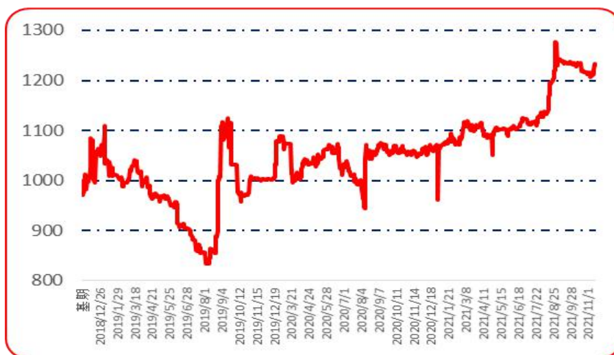
图 6 锥形椒批发价格指数运行图