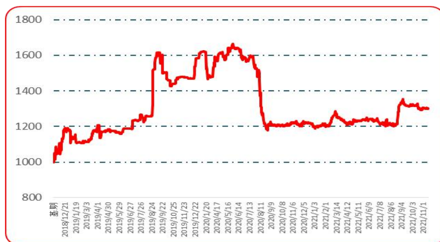
图 3 艳椒批发价格指数运行图