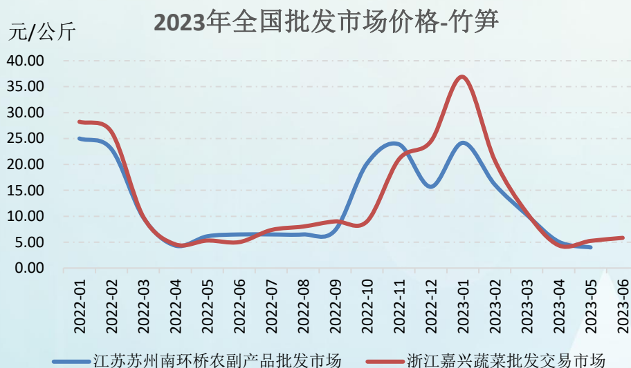
图 3 2022-2023 年竹笋批发市场价格（单位：元/公斤）