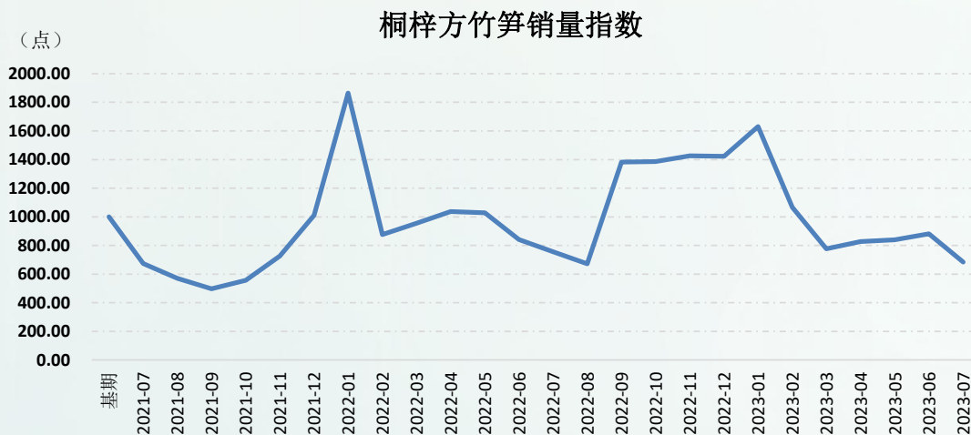
图 1 新华·桐梓方竹笋销量指数