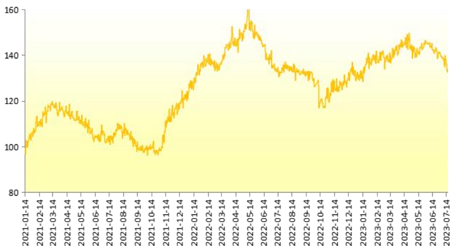
图 4 新华-香蕉销地批发价格指数