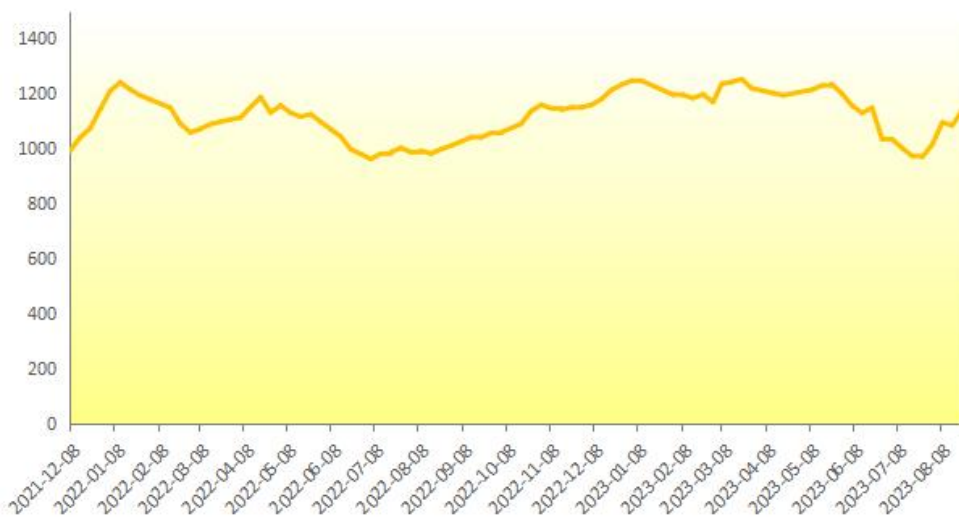
图 5 新华-进口香蕉价格指数