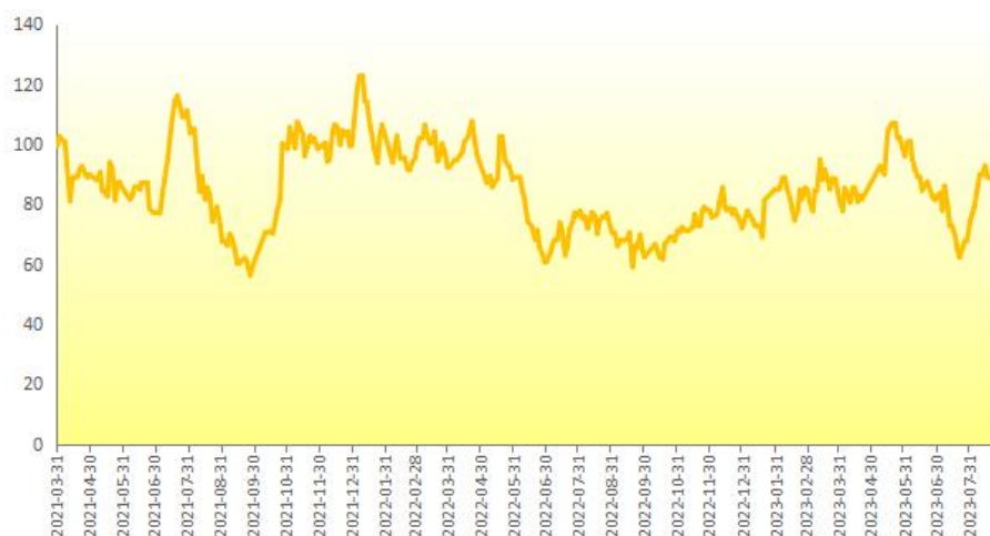
图 1 新华-香蕉产地价格指数