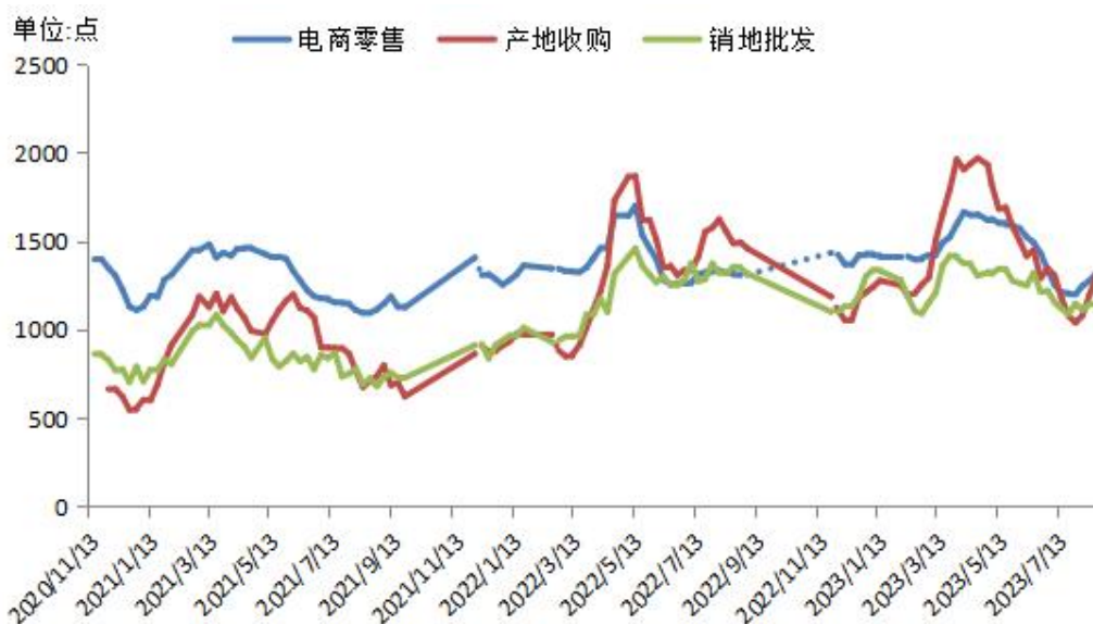
图1 新华·宜昌秭归脐橙系列价格指数走势（单位：点）