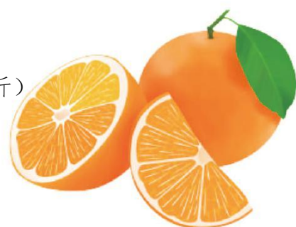
表4 重点批发市场脐橙销售价格（单位：元/公斤）