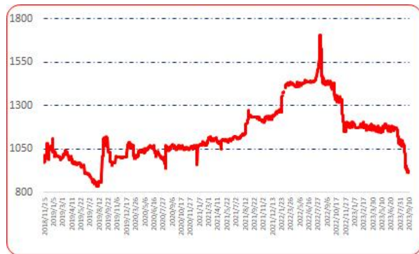
图 6 锥形椒批发价格指数运行图