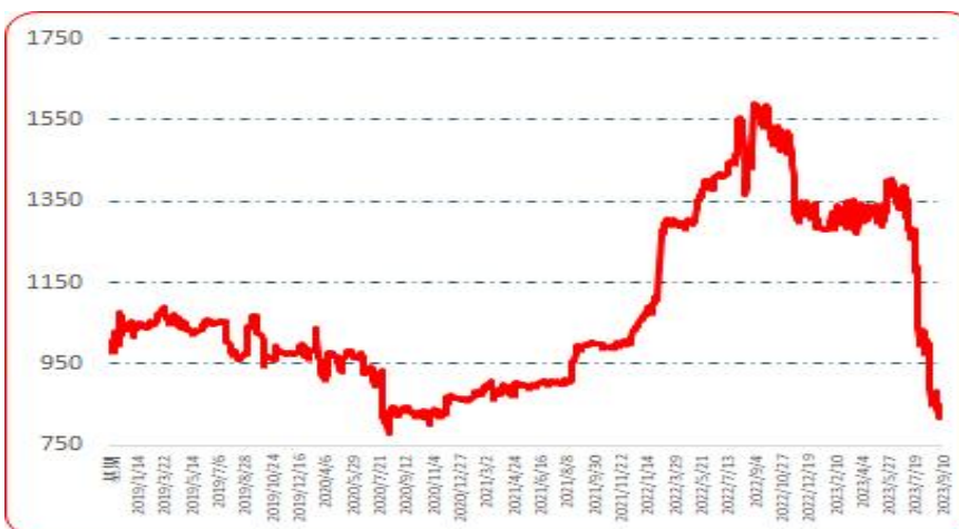
图 7 樱桃形椒批发价格指数运行图