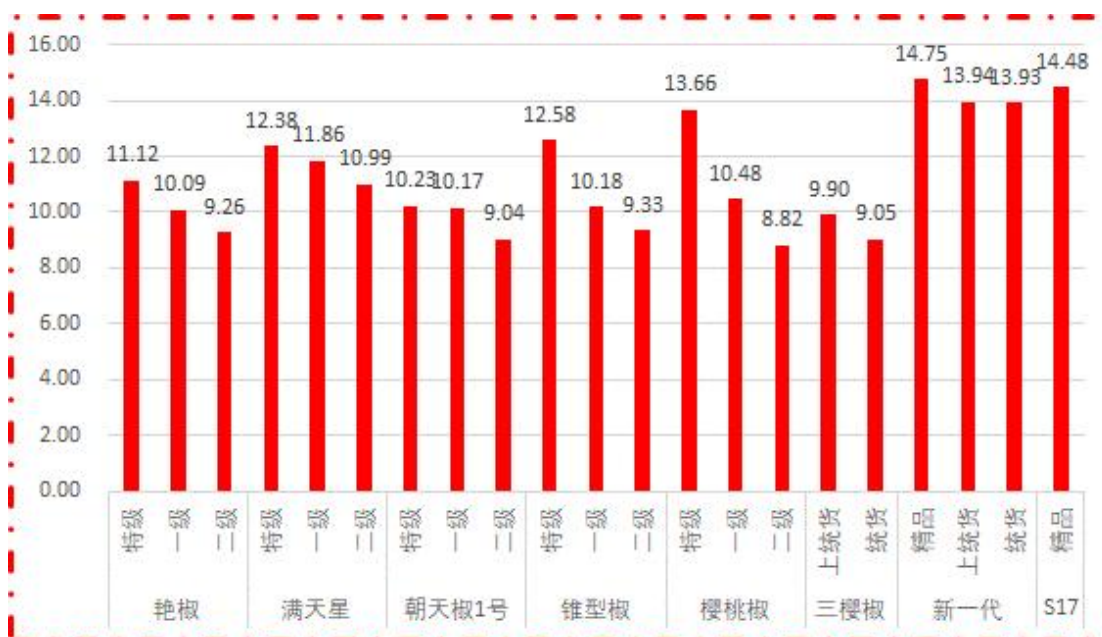
图 1 各品种、各等级周度均价