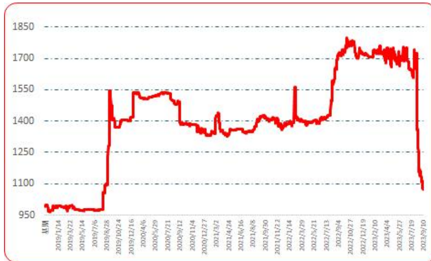
图 5 遵义朝天椒 1 号批发价格指数运行图