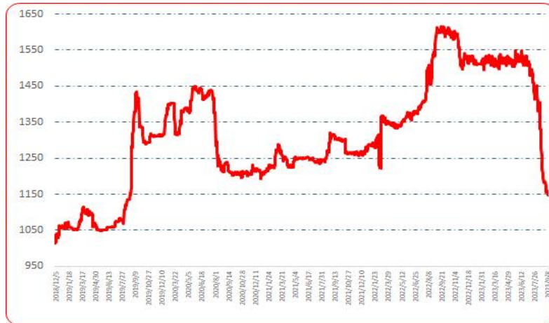
图 2 中国遵义朝天椒（干椒）批发价格综合指数运行图