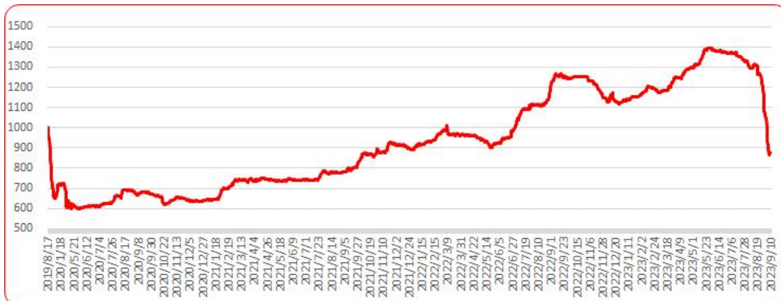
图 8 三樱椒（干椒）批发价格指数运行图