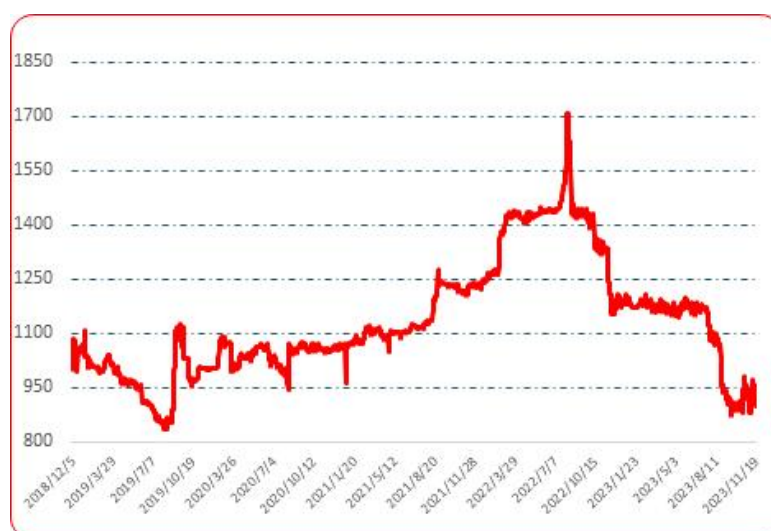
图 6 锥形椒批发价格指数运行图