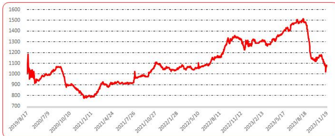
图 9 新一代（干椒）批发价格指数运行图