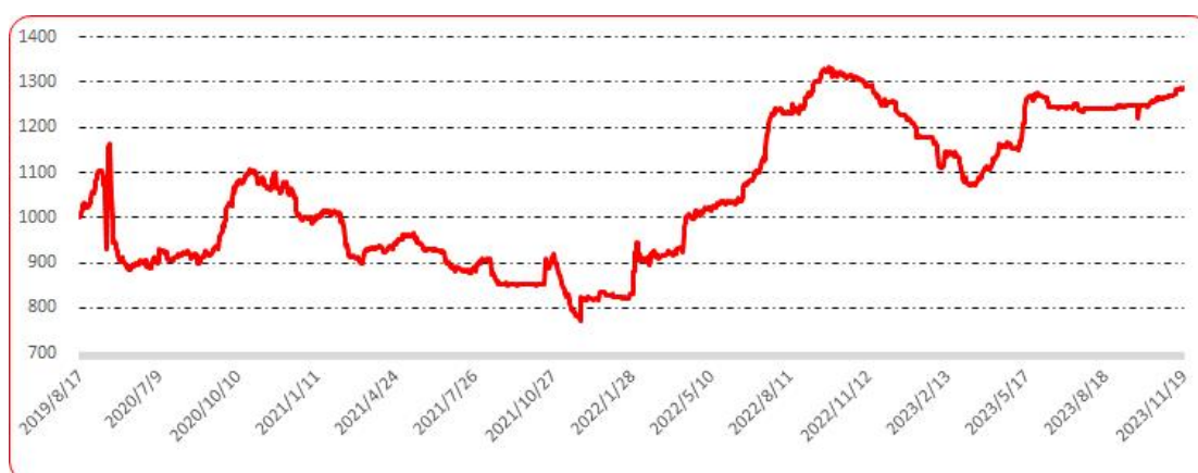
图 10 印度进口椒批发价格指数运行图