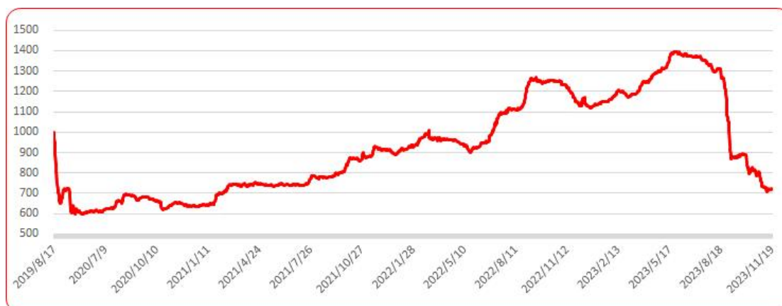
图 8 三樱椒（干椒）批发价格指数运行图