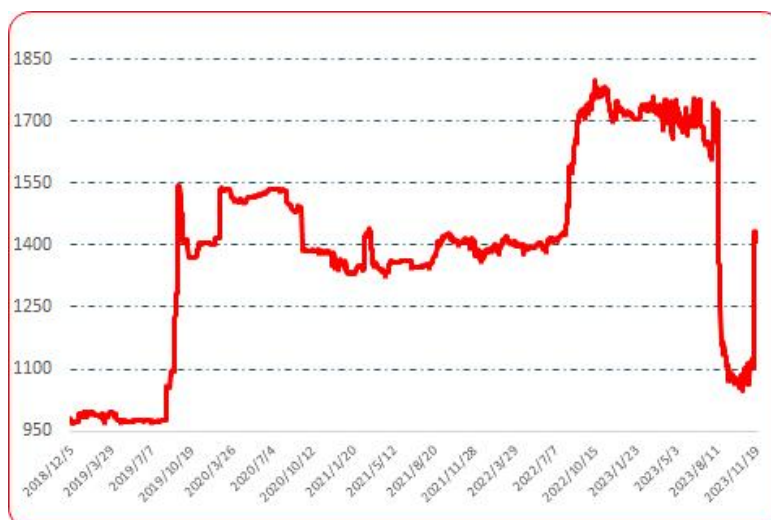
图 5 遵义朝天椒 1 号批发价格指数运行图