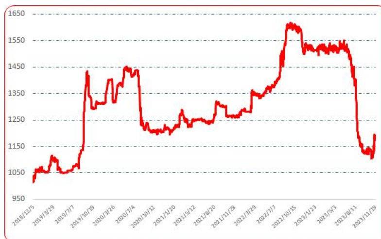
图 2 中国遵义朝天椒（干椒）批发价格综合指数运行图