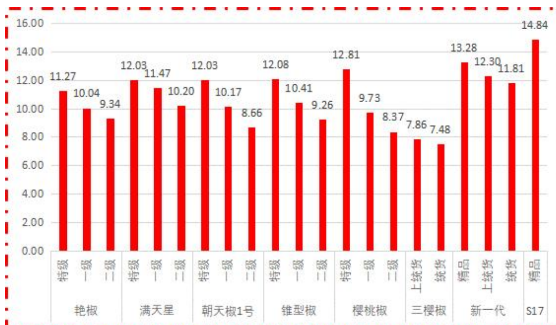
图 1 各品种、各等级周度均价