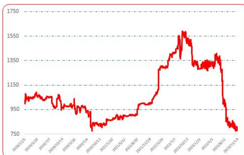
图 7 樱桃形椒批发价格指数运行图