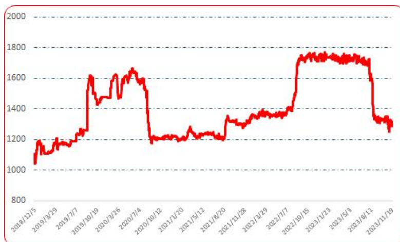
图 3 艳椒批发价格指数运行图