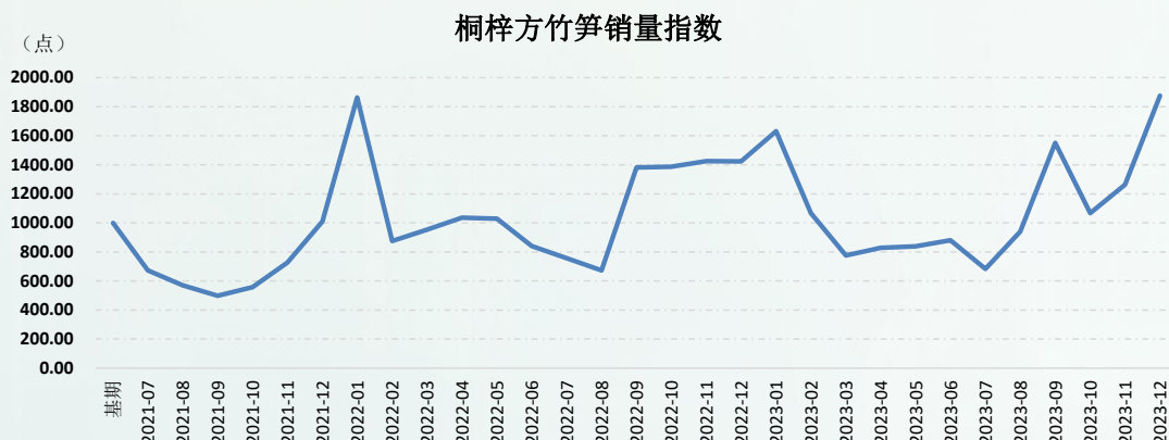
图 1 新华·桐梓方竹笋销量指数