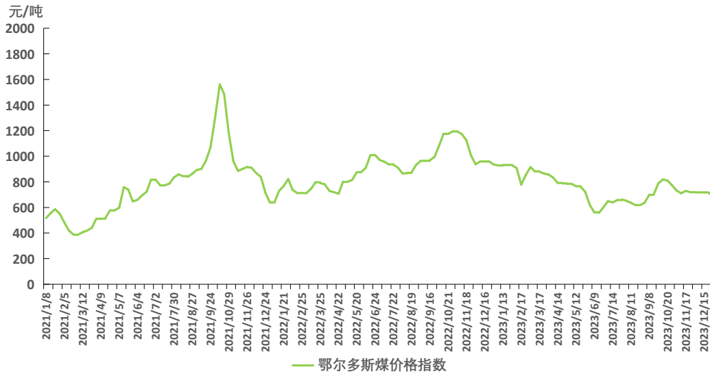
图 1 鄂尔多斯煤价格指数运行图

本期鄂尔多斯煤价格指数小幅下跌。截至 12 月 29 日，指数报 695 元/吨，周环比下跌 17 元/吨，跌幅 2.39%。