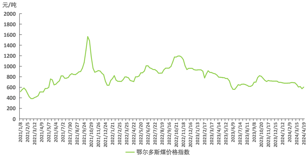
图 1 鄂尔多斯煤价格指数运行图

本期，鄂尔多斯煤价格指数周环比大幅回升。截至 4 月 19 日，指数报 603 元/吨，周环比上涨 29 元/吨，涨幅 5.05%。