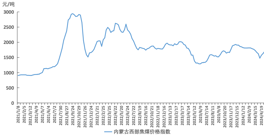
图2 内蒙古西部焦煤价格指数运行图

截至5月10日，内蒙古西部焦煤价格指数报1689元/吨，环比上涨69元/吨，涨幅4.26%。