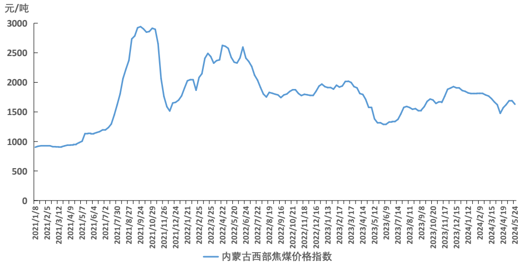
图 2 内蒙古西部焦煤价格指数运行图

截至 5 月 24 日，内蒙古西部焦煤价格指数报 1629 元/吨，周环比下跌 62 元/吨，跌幅 3.67%。