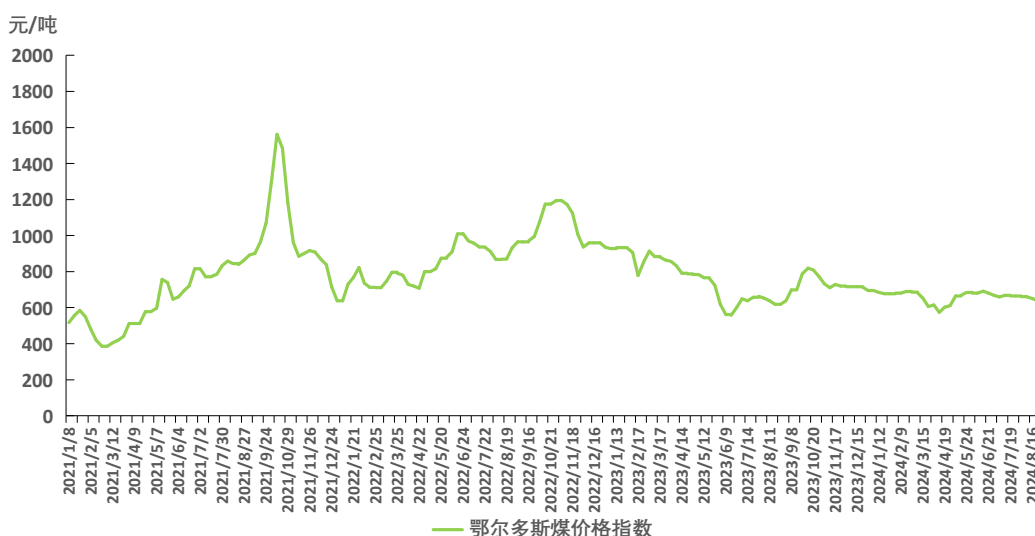
图 1 鄂尔多斯煤价格指数运行图

本期，鄂尔多斯煤价格指数周环比微幅上涨。截至 8 月 30 日，指数报 641 元/吨，周环比上涨 2 元/吨，涨幅 0.31%。