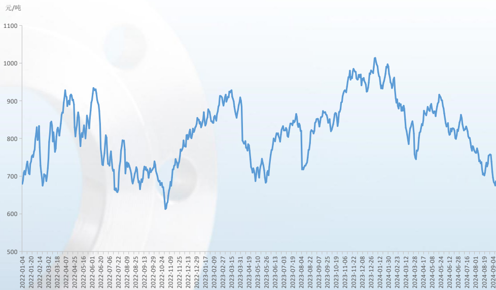
图4 铁矿石活跃合约期货结算价

截至9月15日，钢坯价格报2900元/吨，环比8月31日下跌40元/吨，跌幅1.36%，同比下跌670元/吨，跌幅18.77%。