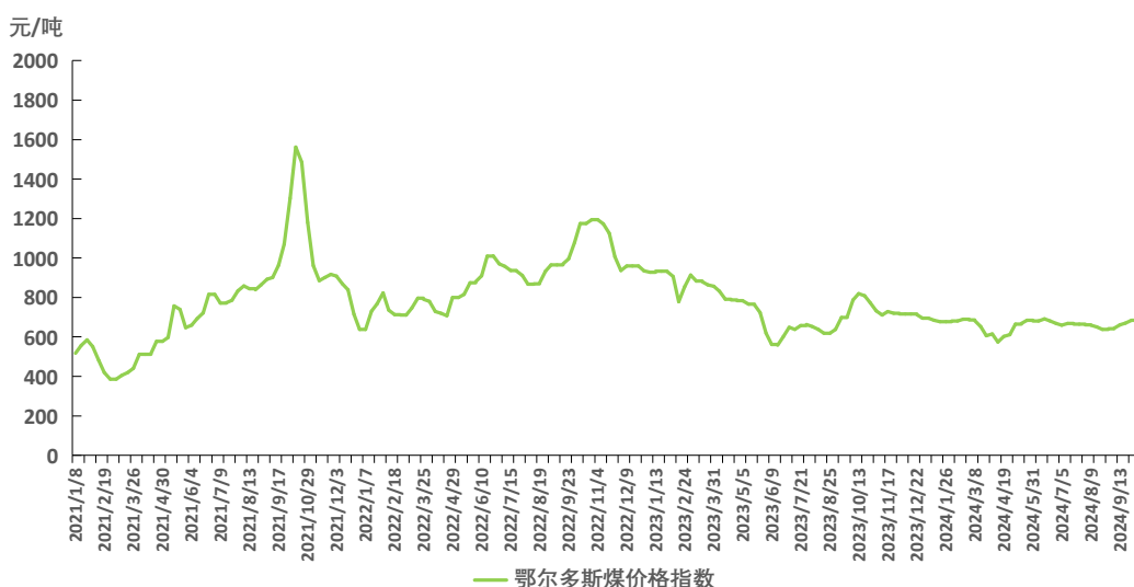
图1 鄂尔多斯煤价格指数运行图

本期，鄂尔多斯煤价格指数周环比小幅下跌。截至10月18日，指数报671元/吨，环比上期下跌8元/吨，跌幅1.18%。