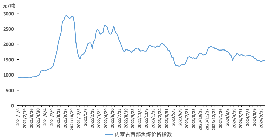
图2 内蒙古西部焦煤价格指数运行图

截至10月18日，内蒙古西部焦煤价格指数报1511元/吨，周环比上涨31元/吨，涨幅2.09%。