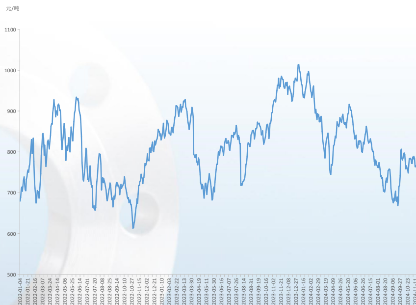
图4 铁矿石活跃合约期货结算价

截至11月15日，钢坯价格报3040元/吨，环比10月31日下跌120元/吨，跌幅3.80%，同比下跌620元/吨，跌幅16.94%。