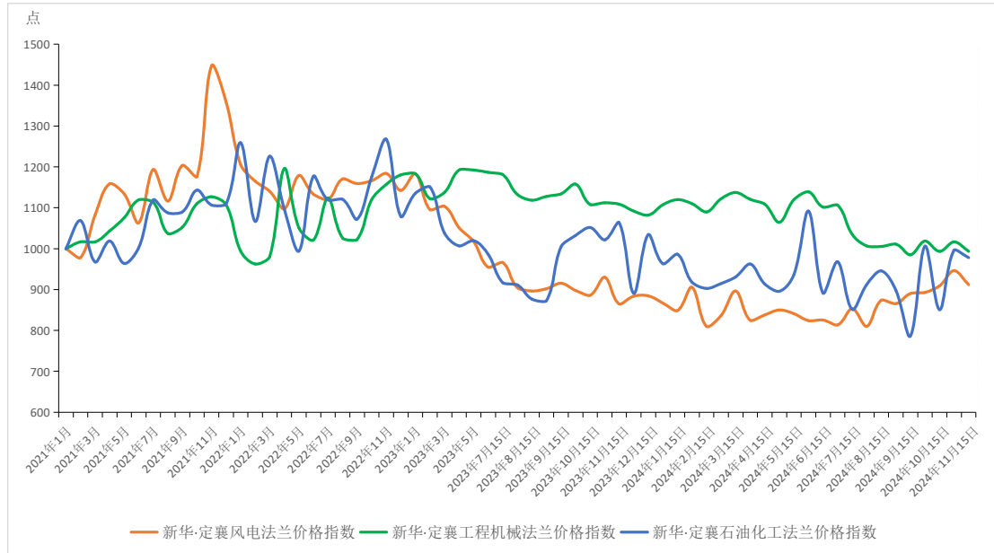
图1 新华·定襄法兰价格指数走势