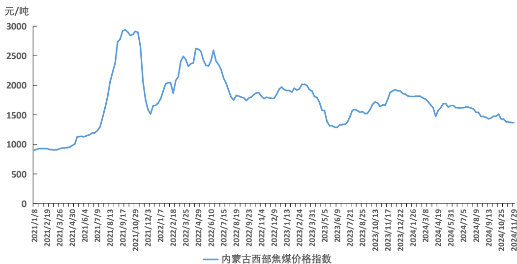
图2 内蒙古西部焦煤价格指数运行图

截至11月29日，内蒙古西部焦煤价格指数报1363元/吨，周环比下跌4元/吨，跌幅0.29%。