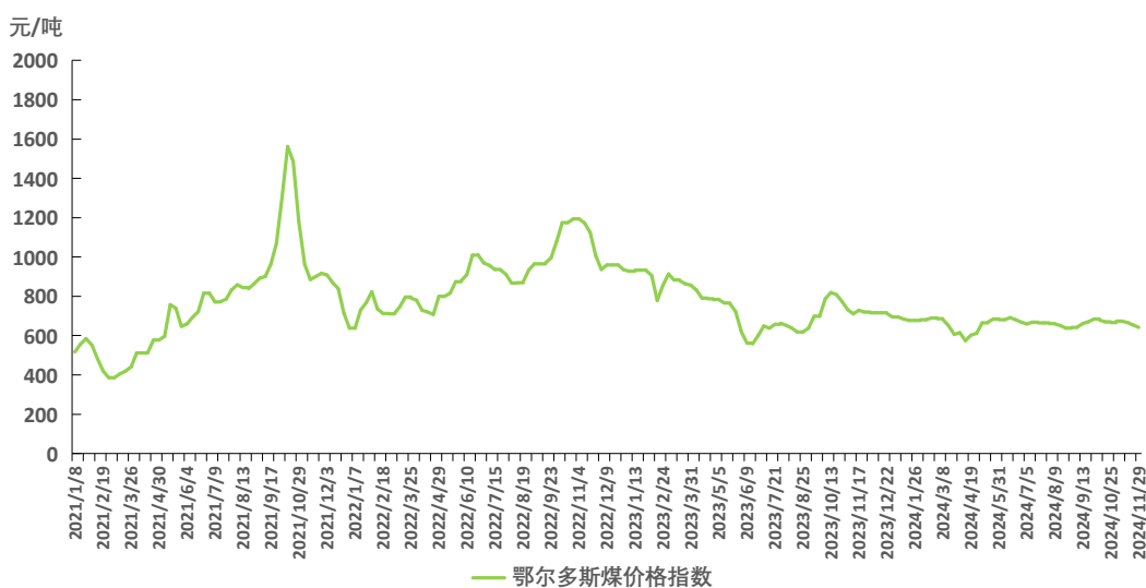
图1 鄂尔多斯煤价格指数运行图

本期，鄂尔多斯煤价格指数周环比小幅下跌。截至11月29日，指数报641元/吨，周环比下跌14元/吨，跌幅2.14%。