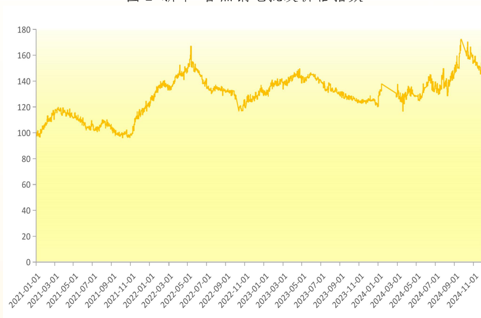
图 2 新华-香蕉销地批发价格指数