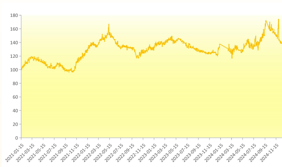
图 2 新华-香蕉销地批发价格指数